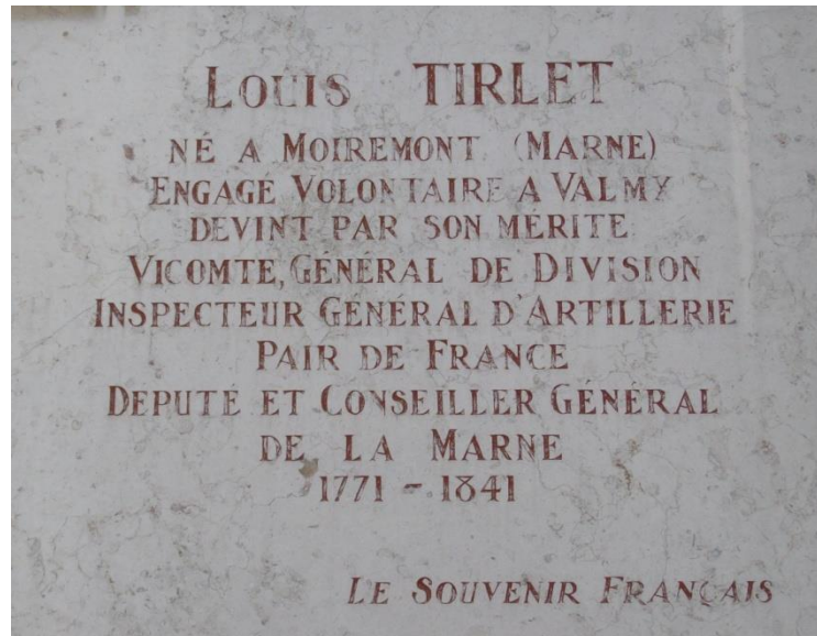
Plaque apposée à gauche de l'entrée de la cité administrative

Châlons-en-Champagne. Apposée à l'initiative du Souvenir Français elle est devenue pratiquement illisible. Un coup de jeune s'avère nécessaire.